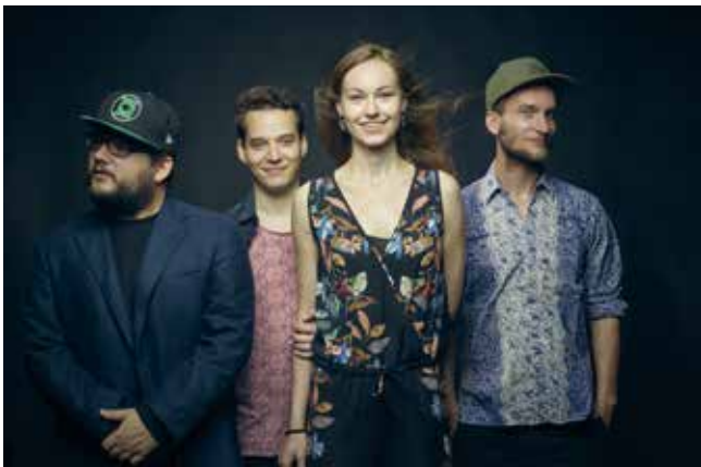
by _ Felix Groteloh

Information: www.shizzle-kultur.at , info@shizzle-kultur.at