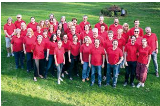
by — Allegro Vivace

Information: www.allegrovivace.at , cfw@chorforumwien.at