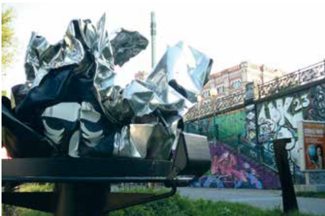
Skulpturen Summerstage II, Hans Kupelwieser