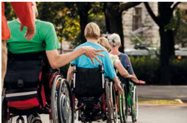
Karawanentanz, by —Andrea Peller