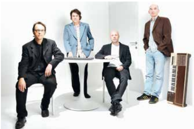
by - Johannes - Zimmer

Information: www.sfd.at , www.wirsindwien.com