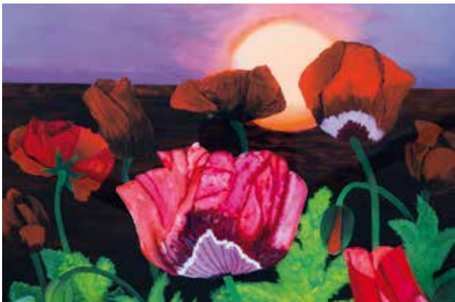
Mohn, by — Jutta Kratky