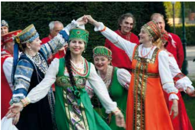
Pomalifest Kalinka