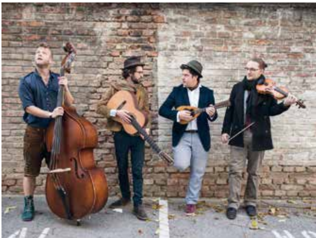
Die Wandervögel by_K. Löffelmann

In diesem Herbst verwandeln drei herausragende Ensembles mit ungemein vielseitigen Programmen den stimmungsvollen Sobieskiplatz in ein Konzertpodium unter Platanen. Die Idee der „Schubertiaden“ aufgreifend, findet sich neben der Musik des größten Wiener Komponisten auch Neukomponiertes und raffiniert Arrangiertes, Klassisches und Wienerisches. Mit Die Wandervögel Bei Schlechtwetter: Atelier Sabine Pleyel (Sobieskigasse 8). Das Atelier (Skulpturen – Grafiken – Radierungen) ist nach den Konzerten für Besucher geöffnet! 1090, Sobieskiplatz, vor dem Brunnen Eintritt frei Information: kultur.vor.ort@basiskultur.at