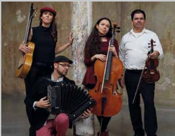
Wiener Lagen, by_H. Zotti