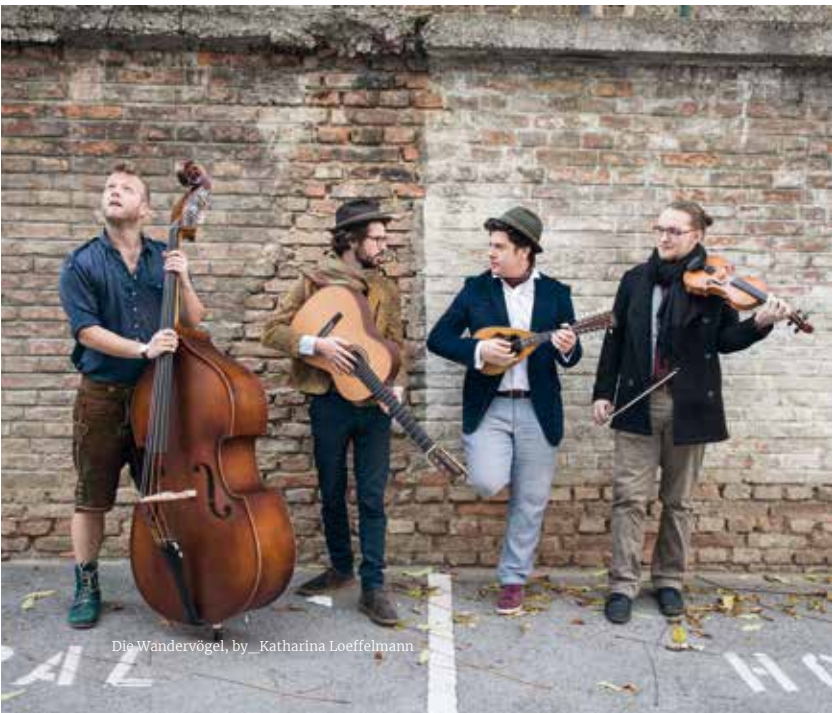
Die Wandervögel, by_Katharina Loeffelmann