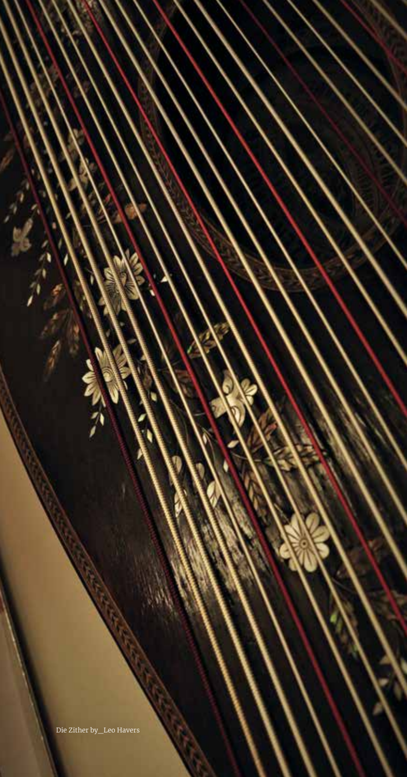
Die Zither by _Leo Havers