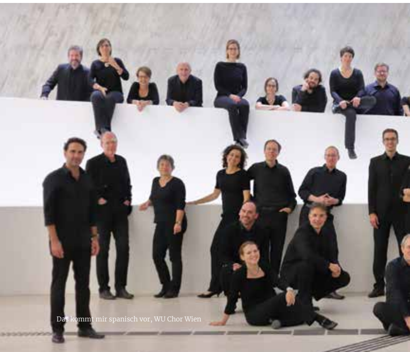
Das kommt mir spanisch vor, WU Chor Wien