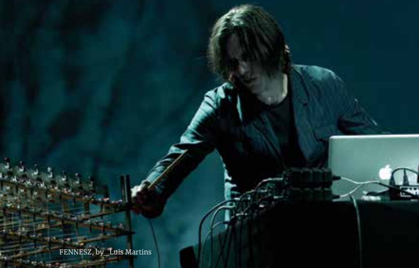
FENNESZ, by Luis Martins